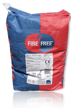
FireFree® B280 Brandgips. Sæk af 20 liter.